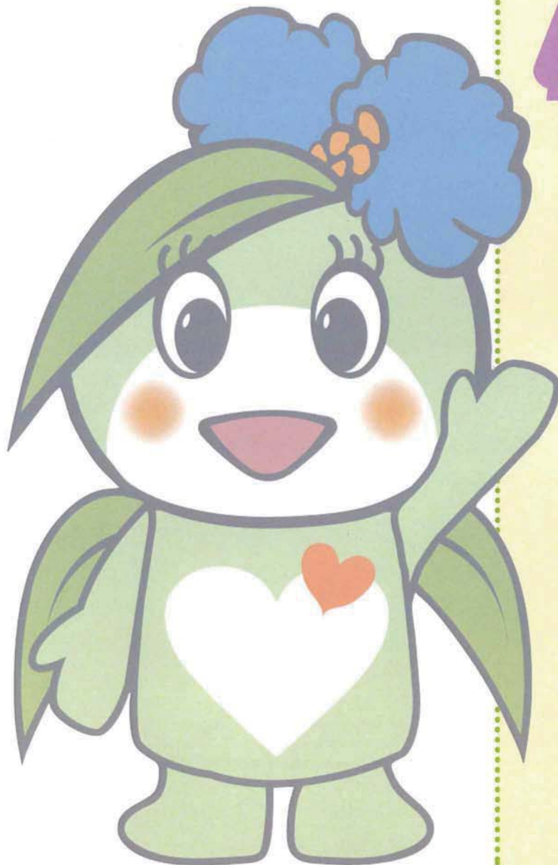
くさつ ししゃきょう 草津市社協キャラクター ふくちゃん