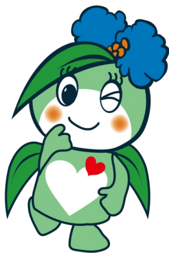
草津市社協キャラクター ふくちゃん