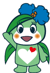
草津市社会福祉協議会 キャラクター 「ふくちゃん」