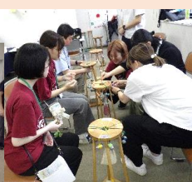
福祉事業所が大事にしている信念