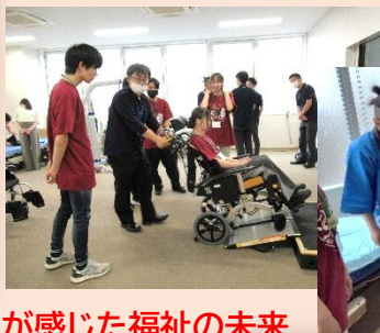
学生が感じた福祉の未来