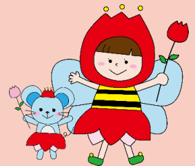
チューリップ事業イメージキャラクター チュウちゃん&リップちゃん